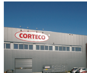
Una catena distributiva aftermarket a livello globale