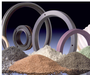
Materie prime per un altissimo livello di performance