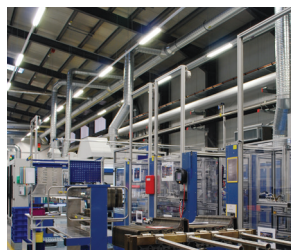
Des processus de production maîtrisés