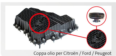
Coppa olio per Citroën / Ford / Peugeot

Materiale: plastica Maggiori informazioni: www.ecatcorteco.com