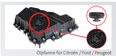
Ölpanne für Citroën / Ford / Peugeot