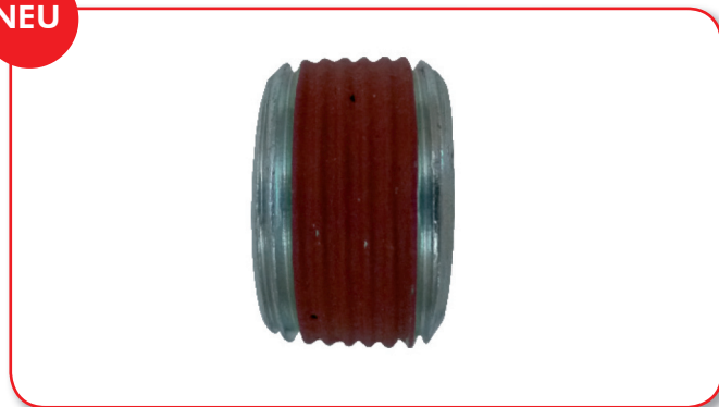
Abbildung 2: Neue verbesserte Ölablassschraube 220127S, 220127H